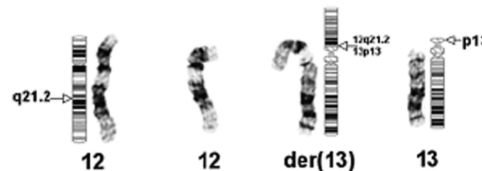
圖2—胎兒的部分染色體核型